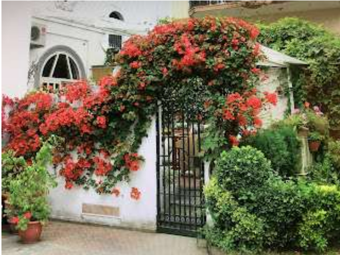
Fig.4 ingresso serra