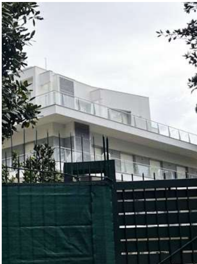
Fig.2 Villa Grimaldi

retro un notevole appezzamento di terreno, che potrebbe diventare uno splendido giardino, eventualmente con piscina, attualmente una fitta boscaglia. Da tempo sono in vendita ad un prezzo elevato e non trovano compratori.