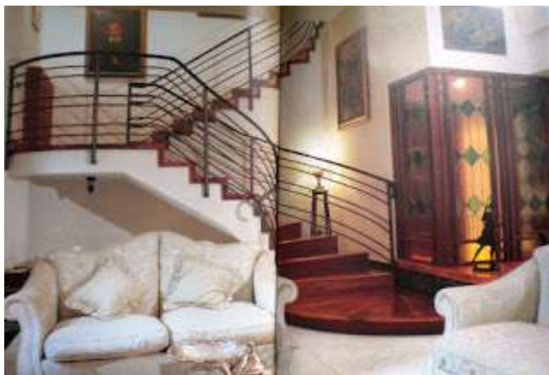
6 - Inizio delle scale