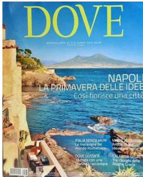
Fig. 7 - Villa Capasso