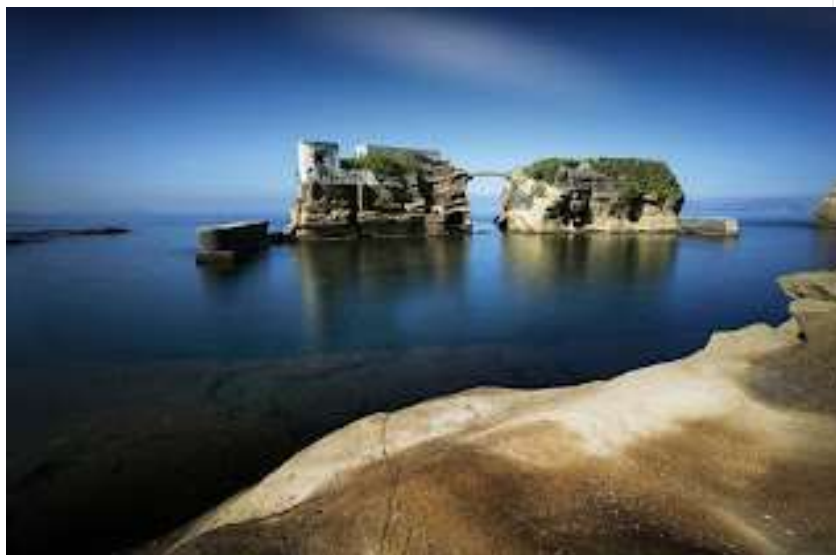
fig. 3 - Isolotto della Gaiola

Negli anni, per fortuna dei napoletani e per sfortuna del nostro anfitrione, il monarca del grano incappò in una serie di disavventure giudiziarie, che si conclusero con l'esproprio delle sue proprietà, le quali, passate allo Stato, sono ora di godimento pubblico e sono visitabili ogni giorno, basta percorrere da via Coroglio, l'imponente Grotta di Seiano realizzata in epoca romana dall'architetto Lucio Cocceio, che fu riportata alla luce, riaperta e riadattata nel 1840 da Ferdinando II di Borbone. Il traforo, della lunghezza di circa 780 metri, attraversa la collina tufacea di Posillipo, collegando l'area di Bagnoli e dei Campi Flegrei con il Parco sommerso della Gaiola. Il colpo di grazia al percorso terreno del nostro ospite fu la sua morte violenta: ucciso dalla servitù, che voleva rubare i gioielli di famiglia.