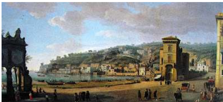
tav. 28 - Gaspar Van Wittel-Veduta del borgo di Chiaia verso Mergellina -Firenze, Galleria Palatina