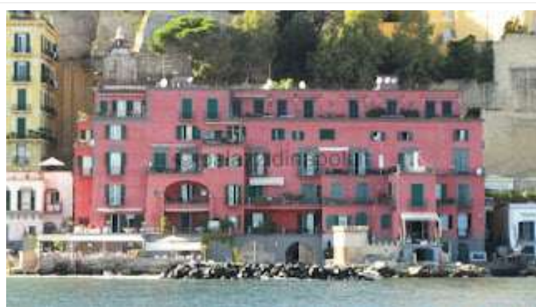
fig. 43 - Villa Quercia