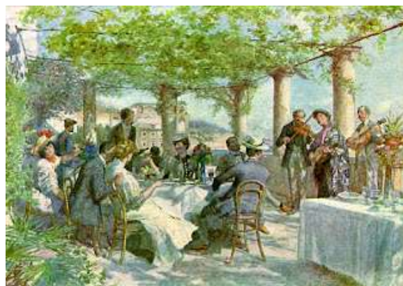
fig. 37 - Trattoria Lo scoglio di Frisio