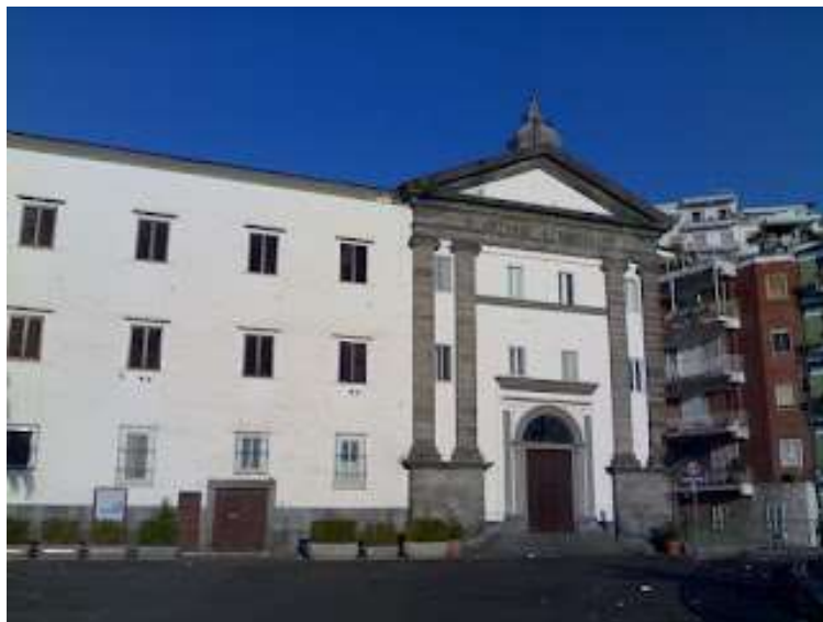
tav. 2 - Chiesa di Sant'Antonio a Posillipo