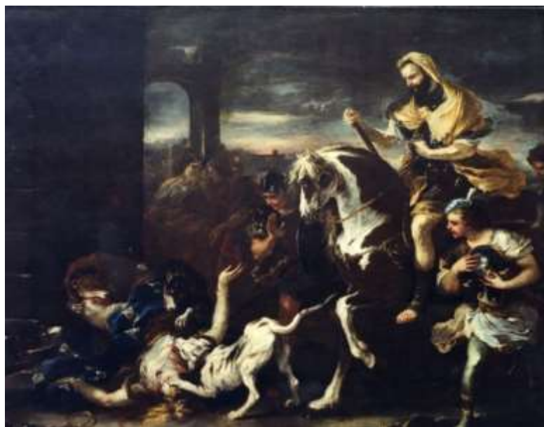
fig. 1 - Luca Giordano-Jezabel divorata dai cani

Il racconto comincia lì dove sorgeva la villa di Vedio Pollione, divenuto ricco col commercio del grano ed amico dell'imperatore Augusto ed in epoca moderna la dimora di Ambrosio, anche lui re del grano e sodale del potente ministro Cirino Pomicino. E fu proprio il braccio destro di Andreotti a favorire il nostro incontro per visionare uno spettacolare quadro di Luca Giordano (fig.1) e preparare il relativo expertise.