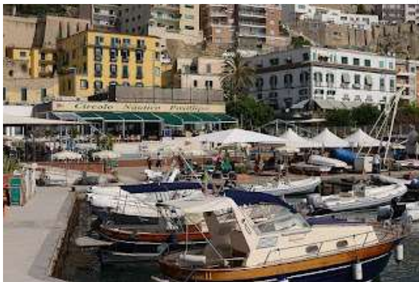
fig. 44- Circolo Nautico Posillipo

E siamo così arrivati al glorioso Circolo Nautico Posillipo (fig.44), ben visibile per l'enorme scogliera che lo circonda e per il verde e rosso dei colori sociali. Tra le abitudini dei napoletani vi è stata sempre quella di associarsi per discutere, divertirsi, ma soprattutto per combattere il terrore della solitudine, stando tutti assieme. Tali organizzazioni esistevano anche nell'antica Grecia e presso i Romani e prosperarono un po' dovunque durante il Medioevo ed il Rinascimento, ma fiorirono maggiormente a Londra ed in Francia durante e dopo la rivoluzione, avendo carattere prevalentemente politico.