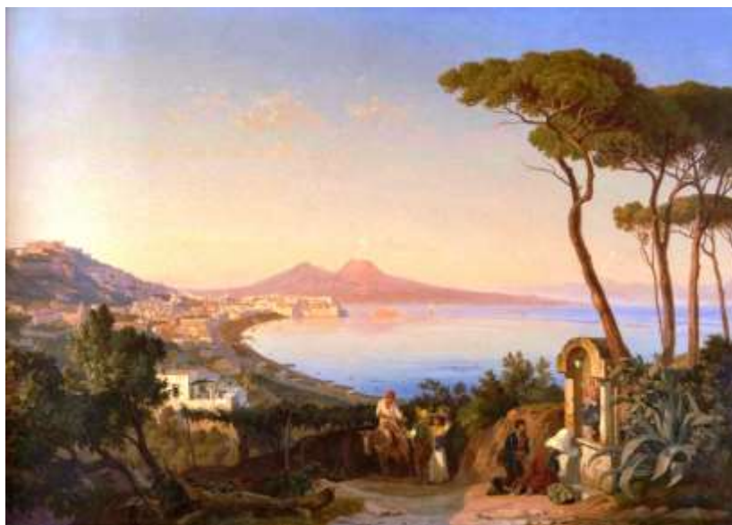
tav. 8 - Carl Goetzloff-Napoli da Posillipo - Italia, collezione privata

Vediamo poi all'opera due Salvatore, il primo famoso: Fergola, che si esibisce in una Veduta della collina di Posillipo da Coroglio (tav.10), esposta nel museo di Capodimonte; il secondo sconosciuto: Gentile, che fa quel che può (tav.11).