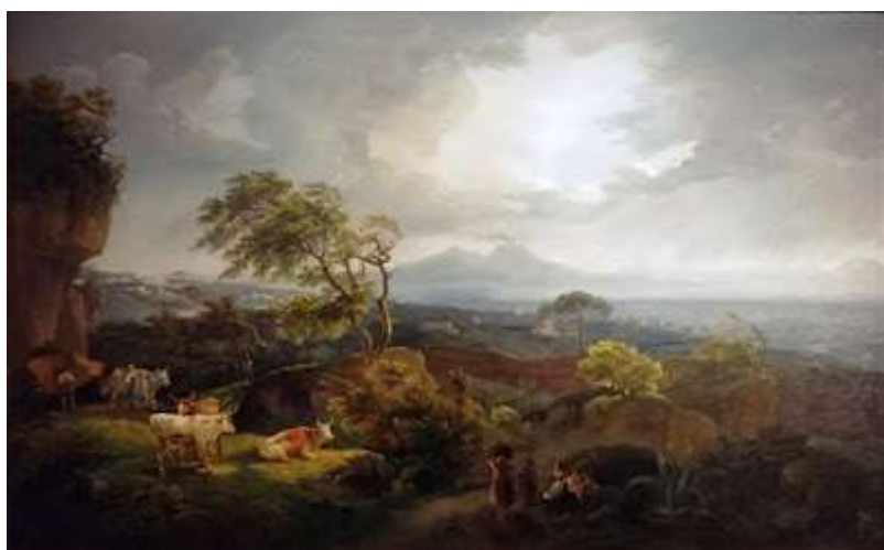
tav. 10 - Salvatore Fergola-Veduta della collina di Posillipo da Coroglio - Napoli, museo di Capodimonte