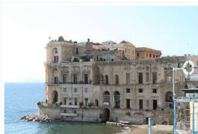
fig. 40 -Palazzo Donn'Anna