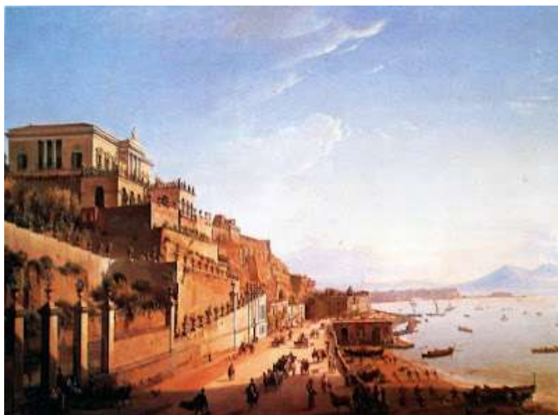
tav. 13 - Frans Vervloet-La strada di Posillipo e Villa Doria d'Angri - Napoli, collezione privata