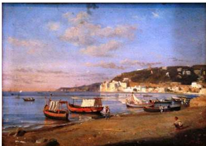
tav. 30 - Teodoro Duclère -Mergellina -Sorrento, museo Correale