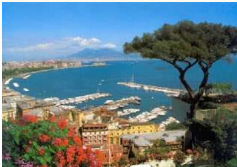
tav. 1 - Panorama

Il pino di Napoli (tav.1) era un albero, della specie Pinus pinea (pino domestico), che fino agli anni Ottanta adornava gran parte delle cartoline con la veduta panoramica della città di Napoli e del golfo partenopeo, con il Vesuvio a fare da sfondo, un'immagine che lo ha reso tuttora un simbolo ben noto dell'oleografia napoletana. Si trovava in prossimità della chiesa di Sant'Antonio a Posillipo (tav.2). In base all'analisi delle