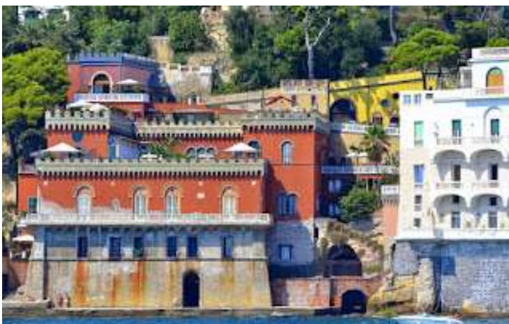
fig. 31 - Villa D'Abro

La seconda, poco distante, villa Cottrau (fig.30), fu costruita nel 1875 da Alfredo Cottrau: ingegnere francese, tra i più celebri progettisti e costruttori di strade, ponti ed altre strutture, ristrutturando una vecchia casa colonica.