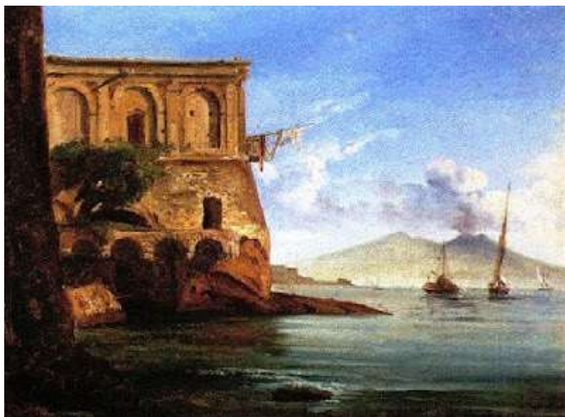
tav. 20 - Sminck van Pitloo - Palazzo Donn'Anna Napoli, collezione privata