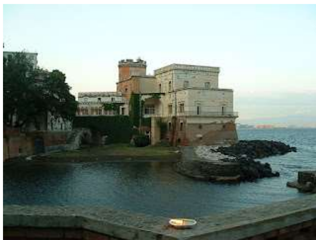
fig. 26 - Villa Peirce , porticciolo e spiaggetta