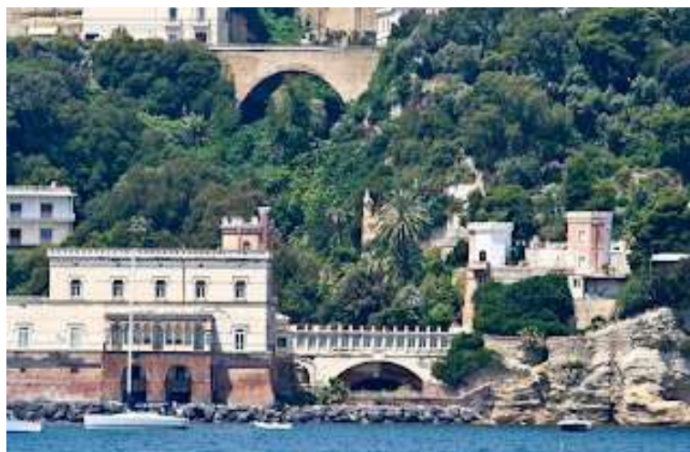
fig. 27 - Villa Peirce