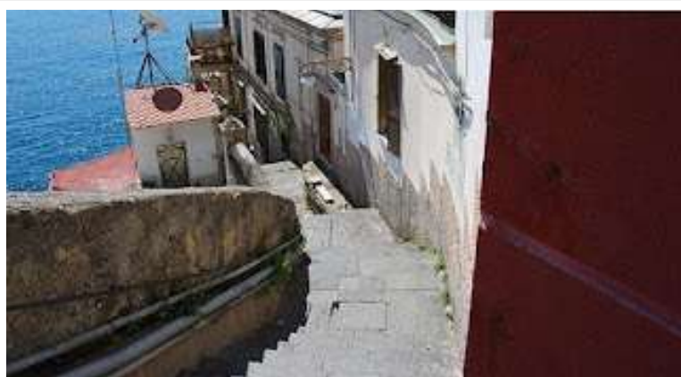
fig. 33 -Discesa San Pietro ai due frati

Poco dopo incontriamo la villa Roccaromana (fig.32) con la sua pagoda di stile orientale e la gigantesca caverna abitata da pallidi fantasmi ed intravediamo la zona di San Pietro ai due frati sulla quale fioriscono numerose leggende. Il mare da via Posillipo si raggiunge percorrendo circa 200 gradini (fig.33) e si arriva a dove abitava Eugenio Buontempo, il famigerato imprenditore pupillo di Craxi. Egli occupava un vasto appartamento (fig.34) a pelo d'acqua, per cui al posto delle persiane aveva delle gigantesche saracinesche. Ho visitato la sua casa, ricca di dipinti e mobili di pregio, oltre ad una ricca biblioteca nel 1991, in un momento drammatico per il proprietario, latitante, mentre Semenzato preparava una memorabile asta per vendere i suoi tesori, nella quale mi aggiudicai molti lotti, ma soprattutto un vero capolavoro degno di un museo: Il Pescatorello di Vincenzo Gemito (fig.35), che da allora riceve gli ospiti che visitano i saloni della mia villa