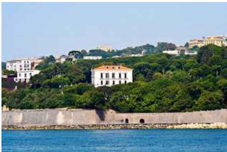
fig. 21 - Villa Rosebery

A ricevere ed intrattenere il fior fiore della «intelligenza» straniera è presente una pattuglia comprendente tutti i più bei nomi della cultura italiana: da Giulio Carlo Argan a Salvatore Accardo, da Cesare Brandi a Domenico de Masi da Luigi Nono a Renzo Piano, da Roberto De Simone a Luigi Firpo, da Maurizio Scaparro a Vittorio Gregotti. Tutti assieme ad ipotizzare degli scenari di risanamento per la realtà napoletana che in passato fu faro del pensiero umano da Gian Battista Vico a Benedetto Croce.