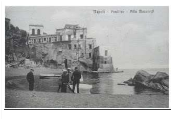
fig. 11 - Villa Mazziotti in una antica cartolina