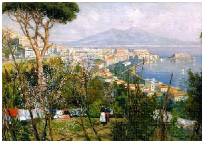
tav. 15 - Attilio Pratella-Panni stesi a Posillipo con vista del Vesuvio - Italia, collezione privata