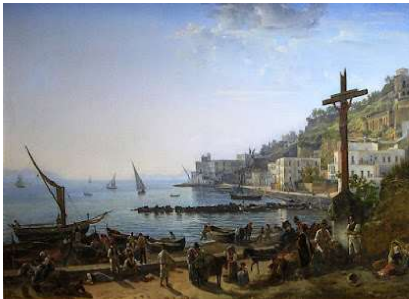
tav. 29 - Silvestr Feodosievic Scedrin-Veduta di Mergellina – Italia, collezione privata