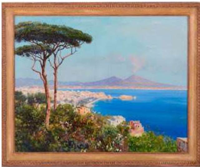
tav. 5 - Veduta-di Napoli con il pino

Quello di Napoli, quello che per lustri e lustri comparve, in primissimo piano, su milioni di cartoline illustrate (tav.7), fino al punto di caratterizzare un'intera città, veniva definito, semplicisticamente, il “pino di Posillipo”.