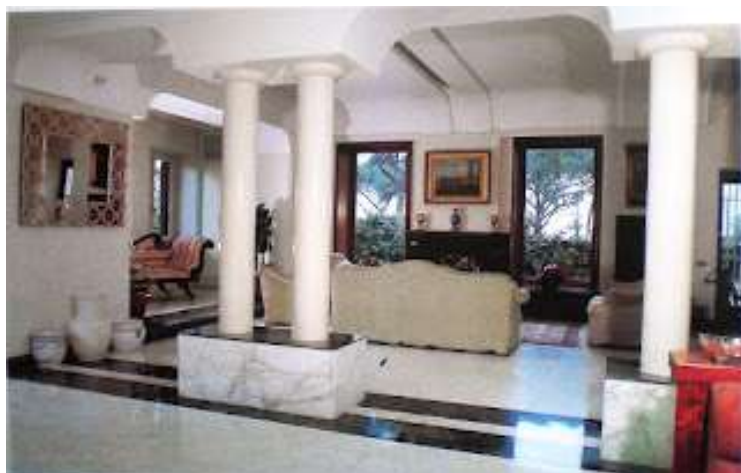
4 - Una parte del salone