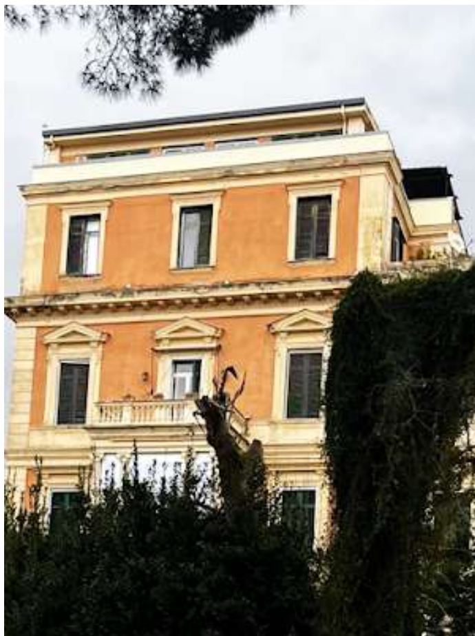
Fig.4 villa Limoncelli

Proseguendo sulla sinistra incontriamo villa Grimaldi fig.4 una volta bellissima con 10.000 metri di giardino, ora in disfacimento, sta per diventare un condominio, con lavori che durano da anni.