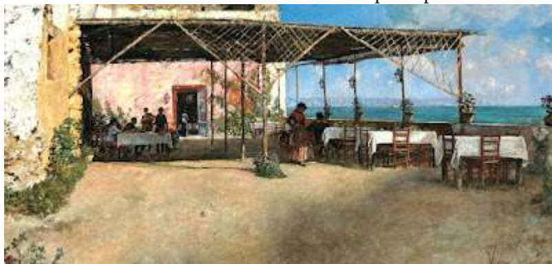
tav. 17 - Vincenzo Migliaro-Taverna a Posillipo Napoli, Galleria di Palazzo Zevallos di Stigliano

Pietro Fabris in Popolani a Posillipo (tav.19) del museo di San Martino ci mostra come trascorreva il tempo la plebe.