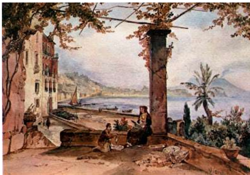
tav. 9 - Achille Vianelli -Posillipo- Italia, collezione privata