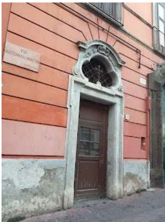
Il portale della cappella privata

Quest'ultimo, arricchì la struttura ingrandendo anche il teatro di palazzo, poiché doveva ospitare varie personalità di spicco: come ad esempio musicisti emergenti e non. Esso occupa uno spazio di circa cento metri quadrati ed è alto circa dieci. Il suo piccolo palcoscenico era dotato di un antico sipario, dipinto con l'allegoria delle Muse.