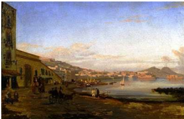
tav. 24 - Giacinto Gigante -Marina di Posillipo – Napoli, collezione privata