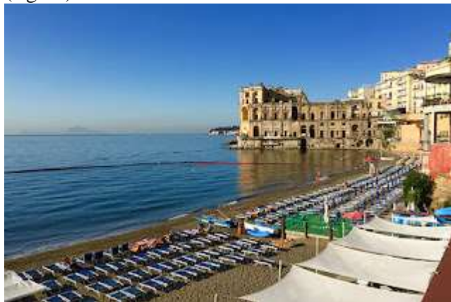
fig15. - Bagno Elena

ballava al suono del mare. A vederla quella piattaforma, sembra una base abbandonata. Come le cabine. Il mare una cloaca (fig.14).