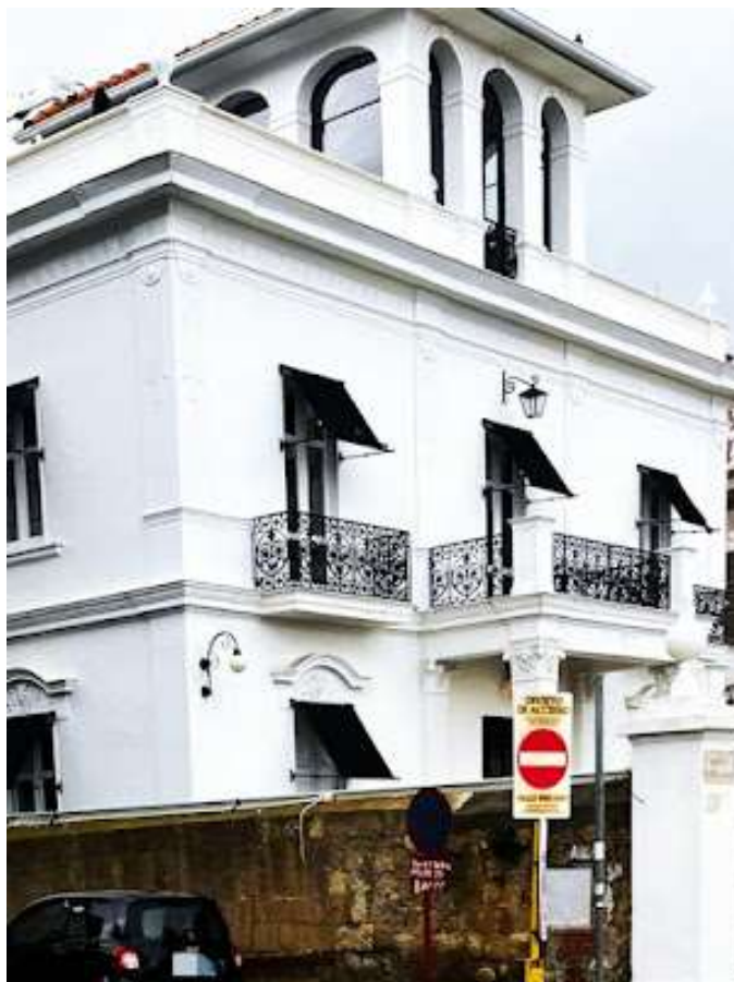
Fig.1 villa bipiano

Proseguendo per via Manzoni dopo l'incrocio con via Orazio incontriamo sulla destra due ville a due piani fig.1-2, con sul