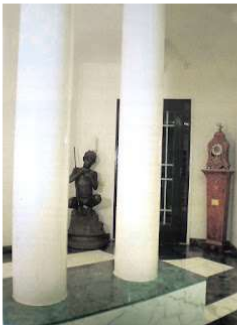
2 - Ingresso