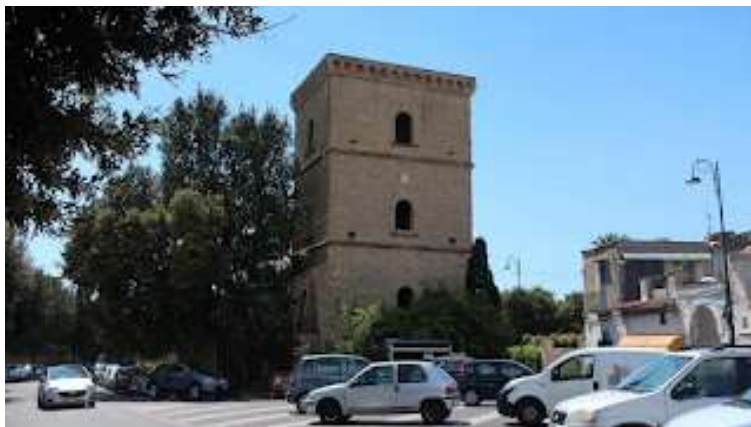
Fig.2 torre Ranieri - XV secolo

impronta questo ultimo tratto di strada, poco prima dell'incrocio con la storica Torre Ranieri (fig.2).