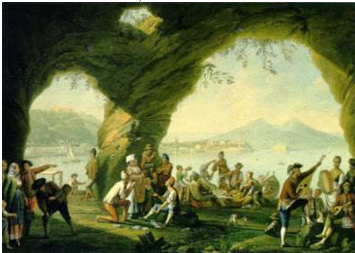
tav. 34 - Pietro Fabris-Scena di vita popolare in una grotta a Posillipo - Napoli, collezione privata