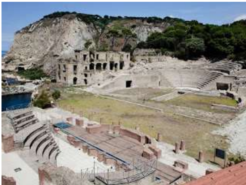
fig. 2 - Teatro romano

Con grande meraviglia ci recammo in un'area contigua alla sua villa dove potemmo ammirare, ben conservato, uno splendido teatro in grado di contenere 2.000 spettatori (fig.2), un Odeion e altre strutture di sommo interesse archeologico, da un ninfeo a delle antiche terme.