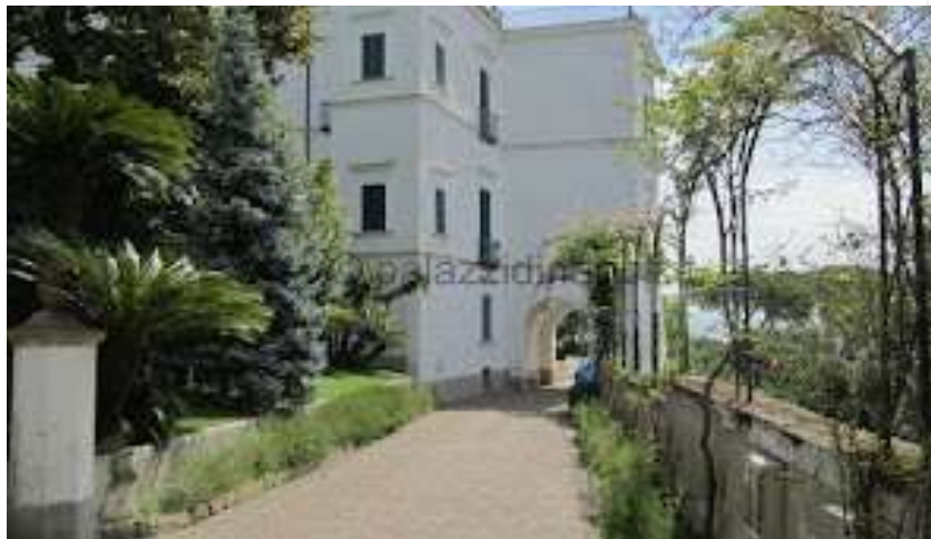
fig. 46 - Villa Ruffo della Scaletta

Dobbiamo ora accennare ad alcune ville poste sul lato destro di via Posillipo, come villa Doria D'Angri (fig.45). Si tratta della più importante villa neoclassica della zona: fu voluta dal principe Marcantonio Doria d'Angri (1809 – 1837) esponente di spicco della famiglia di origini ; i lavori furono completati nel 1833; la fece erigere dall'architetto Bartolomeo Grasso. La struttura sembra che fuoriesca dalla roccia; essa, infatti, è stata appositamente concepita su un grande banco tufaceo, con il quale sembra formare un solo corpo architettonico. Il progetto primitivo, oggi, lievemente alterato dalle aggiunte e dai rimaneggiamenti successivi, prevedeva un'architettura a due piani su un alto basamento a tre ordini di arcate, decorati a bugne in stucco. L'ultimo elemento tecnico regge l'ampia terrazza che circonda l'intera struttura e su cui verte, su ciascun lato, un loggiato con quattro colonne ioniche. I terrazzi laterali