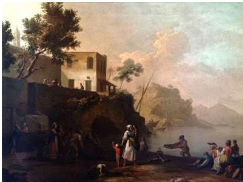
tav. 19 - Pietro Fabris-Popolani a Posillipo - Napoli, museo di San Martino

La mole maestosa di Palazzo Donn'Anna è la protagonista dei prossimi 4 dipinti (tav.20–21–22–23) che presentiamo, prima di passare ad esaminare quadri dedicati a Mergellina: da Giacinto Gigante (tav.24) a Vincenzo Migliaro (tav.25), da Attilio Pratella (tav.26) a Federico Rossano (tav.27).