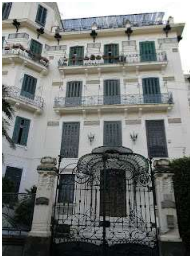
villa Pappone – Napoli - via salita del Casale di Posillipo

Villa Pappone è un esempio straordinario di come lo stile Liberty-floreal si sia fuso con l'architettura napoletana. L'edificio si trova a Posillipo, in una posizione incantevole che offre una vista mozzafiato sulla città.