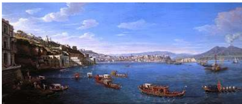
tav. 21 -Gaspare van Wittel-Posillipo con Palazzo Donn'Anna – Napoli collezione privata