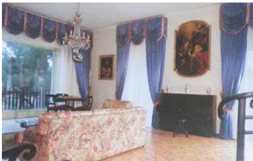
8 - Soggiorno con scorcio di panorama