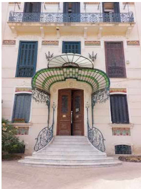
Ingresso con pensilina

fiori artificiali. Il committente impose al progettista uno stile adeguato al modello in auge nei paesi del centro Europa con i quali commerciava e d'altra parte come rinunciare allo stile floreale quando il committente è un commerciante di fiori. La facciata liberty è sottolineata da una bellissima pensilina in ferro e vetri policromi sostenuta da grifoni in bronzo. I motivi floreali sono leggibili nelle balaustre in ferro battuto dal disegno diverso ad ogni piano, nelle cimase delle finestre e nelle maioliche della fascia sottostante il marcapiano, nei mensoloni in bronzo che sorreggono il cornicione. La villa è un autentico capolavoro del liberty napoletano e alcune delle sue soluzioni decorative come il marcapiano maiolicato saranno replicate in diverse costruzioni successive soprattutto al Vomero.