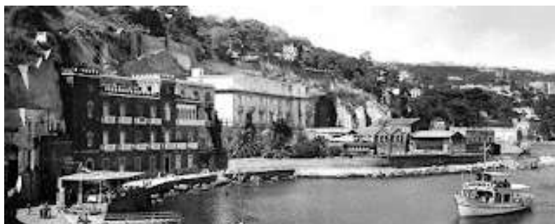
fig. 13 - Riva fiorita