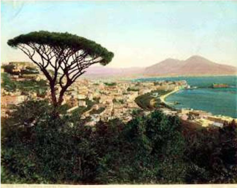
tav. 4 - Il pino di Posillipo in una foto

Sono in pochi a saperlo, ma poteva addirittura fregiarsi di una denominazione scientifica che è quella, poi, con la quale viene catalogata nei libri di botanica: “pinus pinea”. Che significa, press’a poco: “pino da pinoli”, pinoli commestibili (“e pigniuole” in dialetto).