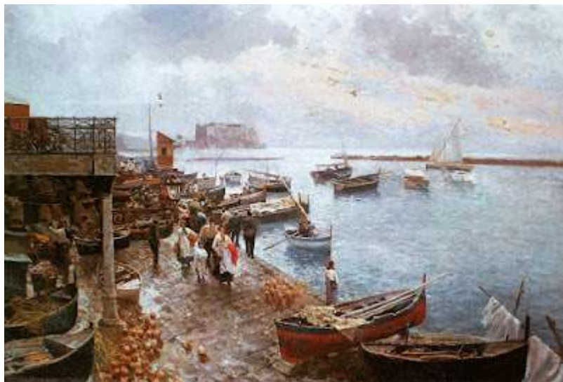
tav. 26 - Attilio Pratella-Il porto di Mergellina -Napoli, collezione privata