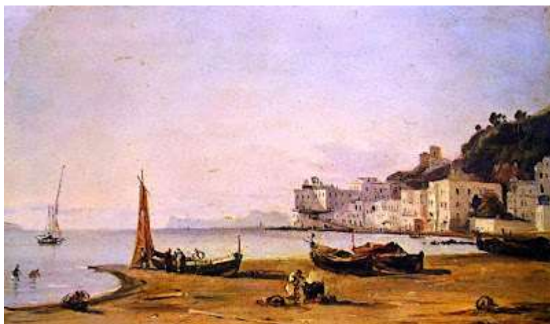
tav. 31 - Sminck van Pitloo-Mergellina -Sorrento, museo Corraale