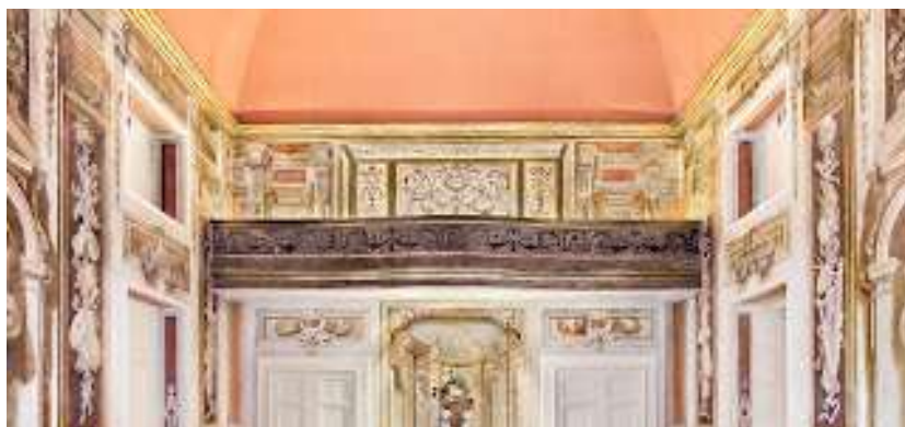
Il teatro o sala della musica