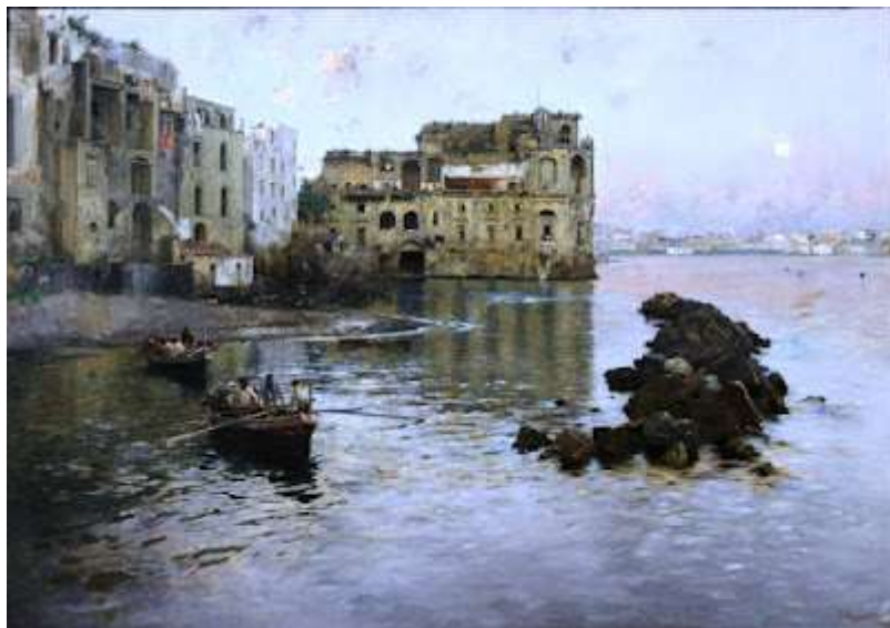
tav. 22 -Gaetano Esposito - Palazzo Donn'Anna a Posillipo - Napoli collezione privata