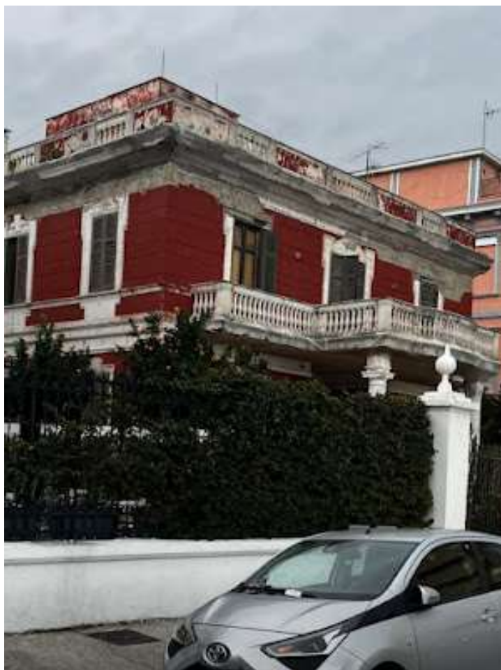
Fig. 3 Villa bipiano

Poco più avanti vi è villa Limoncelli fig.3, una volta dimora nobiliare, abitata dalla famiglia Cosenza, ora un semplice condominio borghese.