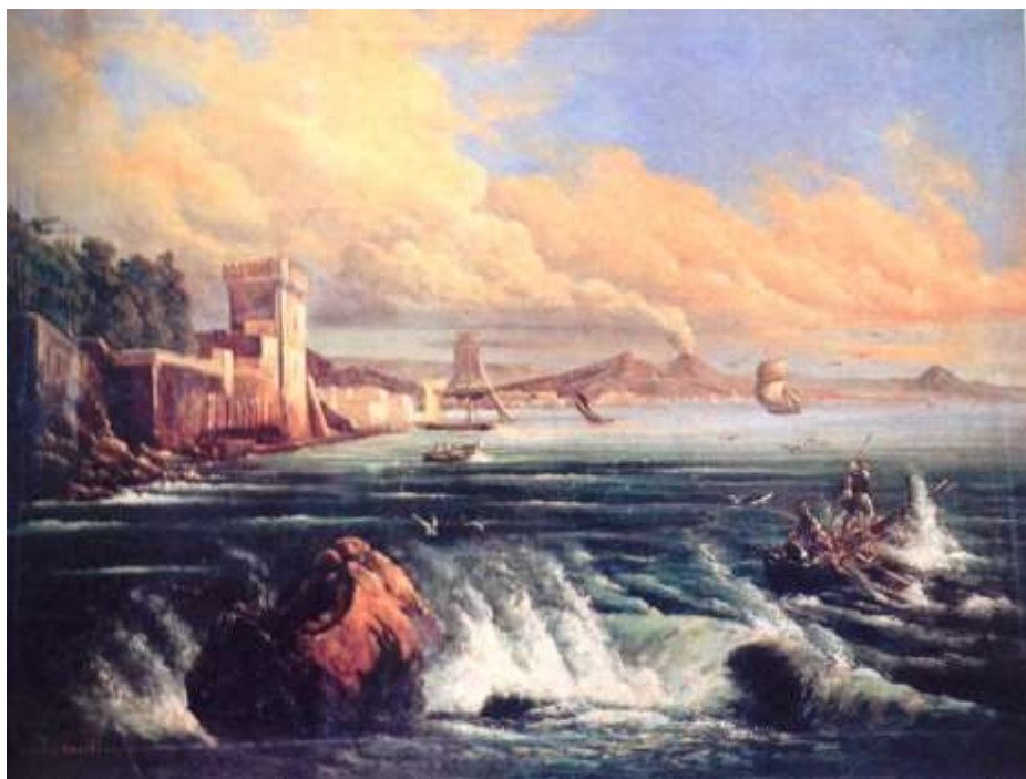
tav. 5 - Consalvo Carelli - Veduta di Napoli da Posillipo - Napoli collezione della Ragione