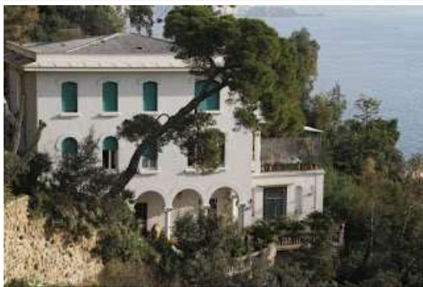
fig. 28 - Villad'Avalos

acquisita dai Pierce nel 1909. In questa residenza si rifugiò per un breve periodo Giuseppe Garibaldi, ormai vecchio e infermo, ma soprattutto era lo sbocco a mare del mitico Comandante. Anche questa villa è stata utilizzata per rappresentare l'esterno di villa Palladini nella famosa soap opera Rai Un posto al Sole. Per molti anni vi sono stati gli studi di Canale 21, la più importante emittente privata campana, alle cui trasmissioni ho spesso partecipato come ospite.