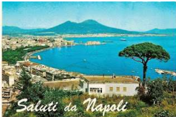
tav. 7 -Cartolina