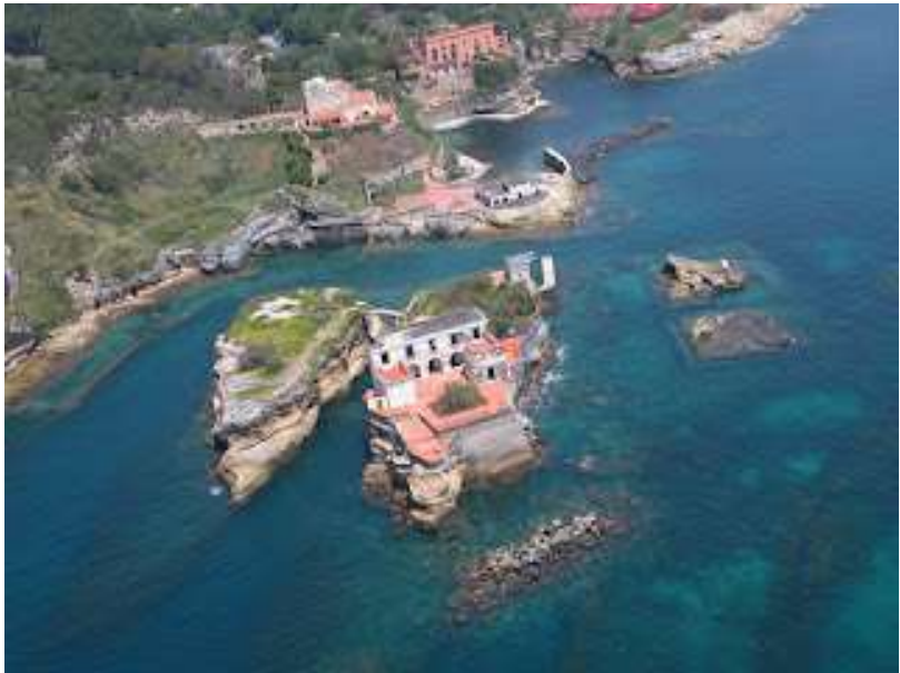
fig. 4 - Isolotto della Gaiola dal cielo

Trovandoci a parlare di scalogna, accenno brevemente a due fugaci visite, ospite di Grappone, della dimora posta sull'isolotto della Gaiola (fig.3-4) e celebre non tanto per il fantastico parco sommerso che lo circonda, quanto per un'oscura maledizione che da decenni incombe sui proprietari e dalla quale credevo fossero immuni i visitatori. Viceversa, siamo nel 1978, dopo pochi mesi dalla frequentazione della casa del noto assicuratore d'assalto, entrambi fummo coinvolti in una penosa disavventura fiscale, dalla quale ho impiegato anni e anni per uscire indenne.