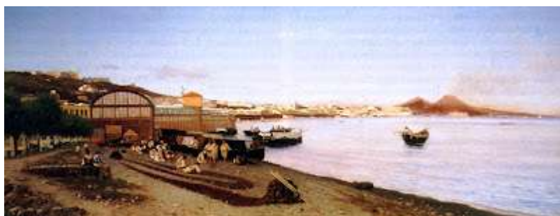
tav. 27 - Federico Rossano-I vecchi bagni a Mergellina – Montecatini, collezione privata