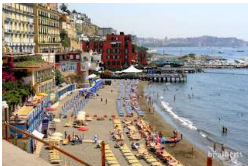
fig. 16 - Bagno Elena