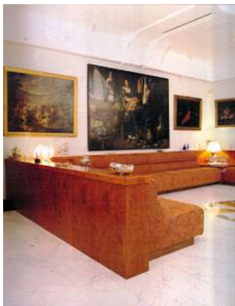
fig. 47 - Salotto villa della Ragione