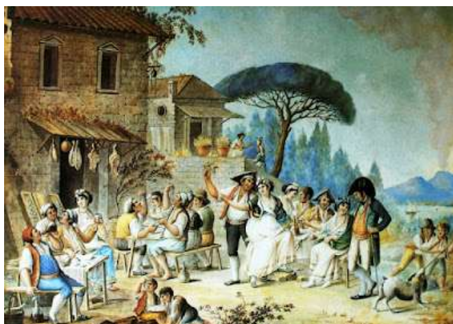
tav. 16 -Alessandro D'Anna-Locanda a Posillipo Roma collezione privata