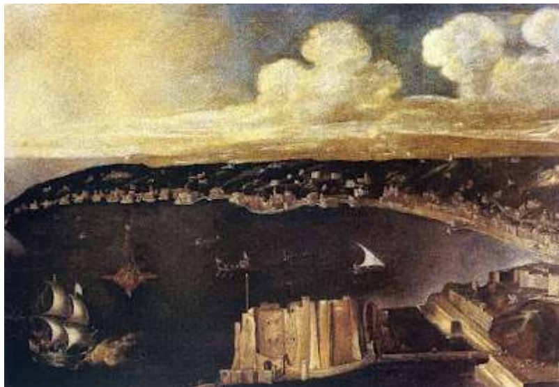
tav. 1 - Didier Barra-Veduta di Napoli con Castel dell'Ovo e Posillipo - Napoli, museo di San Martino

Diamo ora la parola ai pennelli dei tanti pittori che hanno voluto immortalare paesaggi da favola.