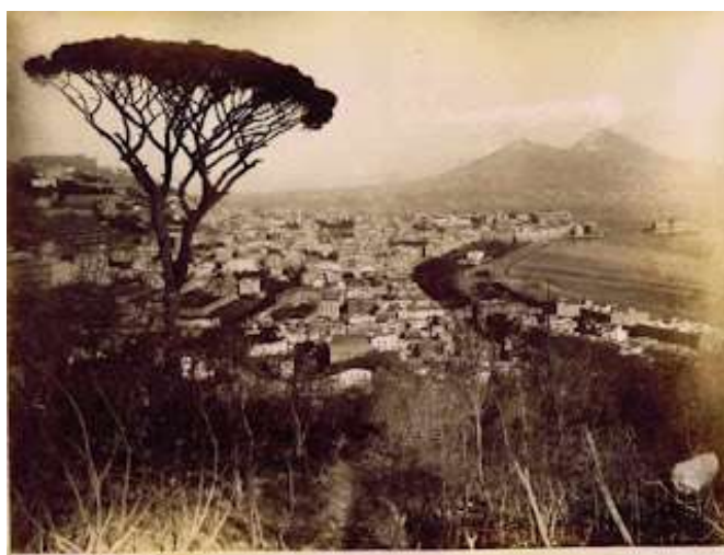
tav. 3 - Il pino di Posillipo in una foto di Sommer Giorgio (1834-1914)