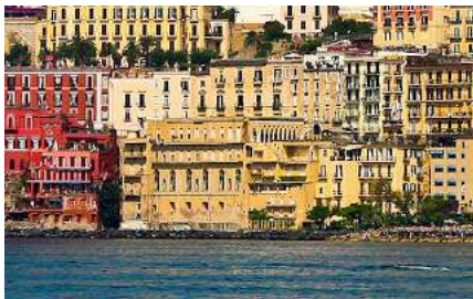
Fig. 38 - Ospizio Marino

Di colore giallo partenopeo si riconosce poi l'Ospizio Marino Padre Ludovico da Casoria (fig.38), una delle strutture storico religiose più interessanti della città, infatti nel 2007 è stata oggetto di una visita guidata dal sottoscritto, presidente della benemerita associazione Amici delle chiese napoletane. L'edificio è stato eretto sul suolo dove, nel XVII secolo, era il palazzo del Castellano: venne costruito nel 1875 ad opera dei frati bigi della Carità. Oggi, le strutture in questione, precisamente dal 1971, sono affidate alle suore francescane. La struttura fu particolarmente voluta da padre Ludovico da Casoria. Il fabbricato, come già accennato, rappresenta una rilevante testimonianza storica, religiosa e artistica. Al suo interno sono custodite due chiese, il sarcofago di padre Ludovico ed altre opere artistiche di pregio: in particolare, è da ricordare l'ambiente che mostra la raffigurazione della Via crucis composta completamente da vivaci maioliche. All'ingresso, su via Posillipo fa bella mostra lo pseudo obelisco scultoreo (fig.39) di san Francesco che in atto benedicente im pone le mani su tre famosi terziari: da sinistra a destra Dante, Cristoforo Colombo e Giotto. Il monumento fu voluto da padre Ludovico e scolpito da Stanislao Lista nel 1882 per il settecentesimo anniversario della nascita del santo d'Assisi.