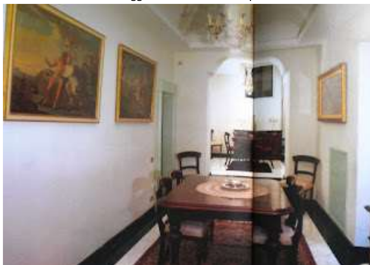
9 - Camere dedicate al gioco