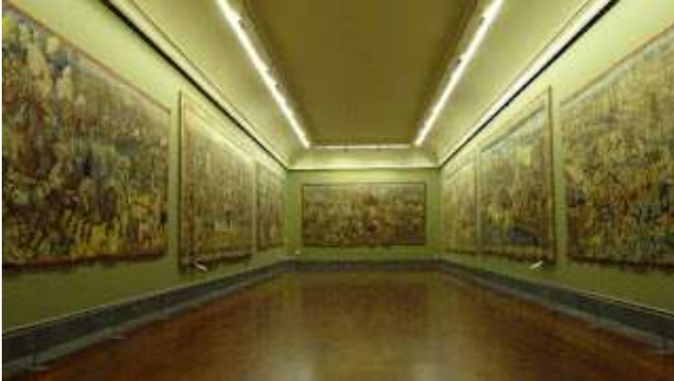
fig. 29 -Sala degli arazzi, museo di Capodimonte

Un sottile filo erotico lega le prossime due ville nel mio ricordo.