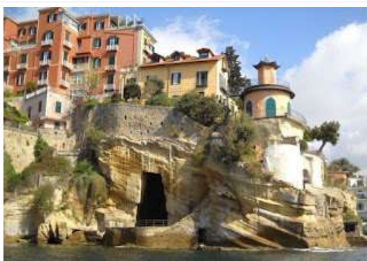
fig. 32 -Villa Roccaromana

Poco distante dalla villa dei piaceri vi è villa D'Abro (fig.31), di colore rosso fuoco e che non ho mai visitato; in compenso ho fatto dei bagni indimenticabili nelle acque antistanti, raggiunte a bordo delle imbarcazioni dei miei amici ricchi.