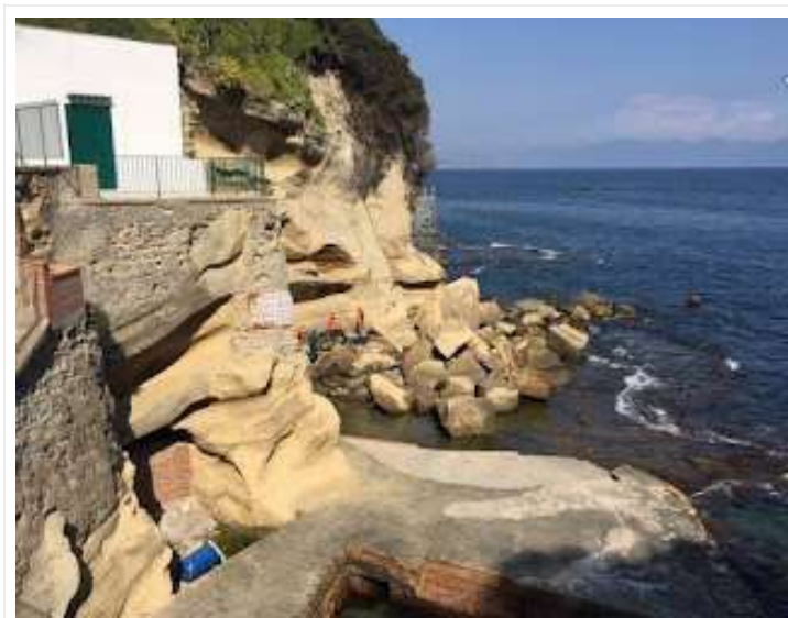
fig. 9 - Il mare che lambisce il parco Sud Italia