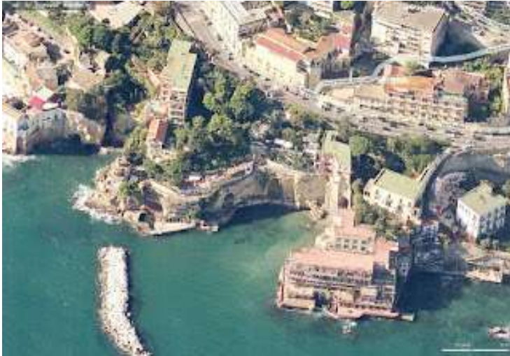
fig. 10 - Grotta romana