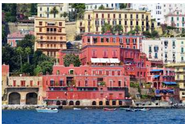
fig. 36 - Villa Pavoncelli

dall'ex casino del duca di Frisia, e convertita nel 1840 nella famosa trattoria dello Scoglio di Frisio (fig.37), ritorna residenza signorile a fine secolo, quando fu acquistata dai conti Pavoncelli ed è oggi un anonimo condominio.