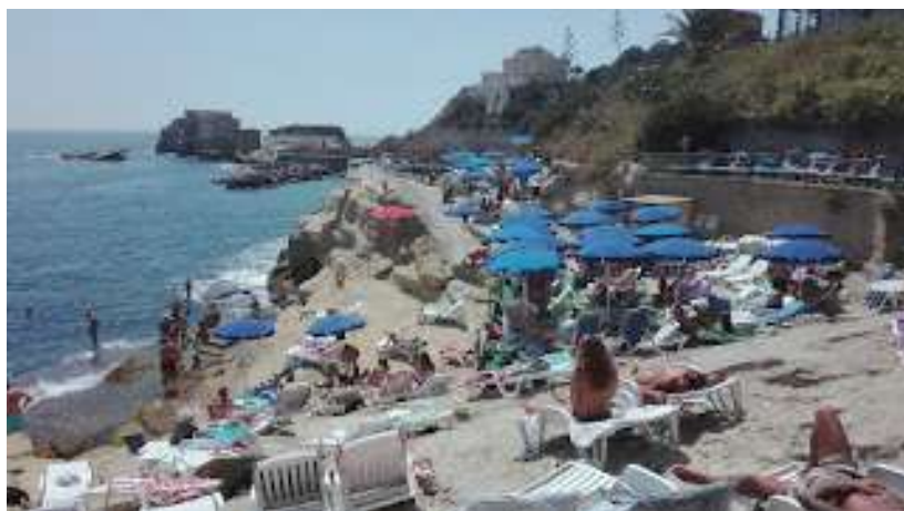
fig. 5 - Villa Imperiale

Non parleremo di Villa Imperiale (fig.5) per la quale invito i lettori a leggere il mio articolo riguardante l'accorsato stabilimento balneare: Com'era bella villa Beck (consultabile su internet digitandone il titolo).