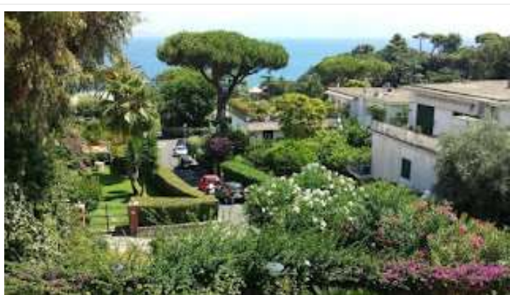
fig. 17 - Parco Rivalta

Continuiamo il nostro percorso e ci imbattiamo in Parco Rivalta, una serie di ville che degradano verso il mare a valle di piazza Salvatore Di Giacomo.