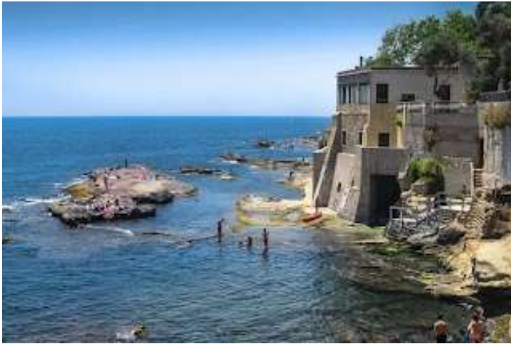
fig. 6 - Villa Capasso