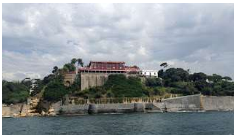
fig. 20 - Villa Barracco

Al primo piano una serie di saloni con centinaia di quadri alle pareti, porcellane preziose e mobili d'epoca; al secondo piano le camere da letto.