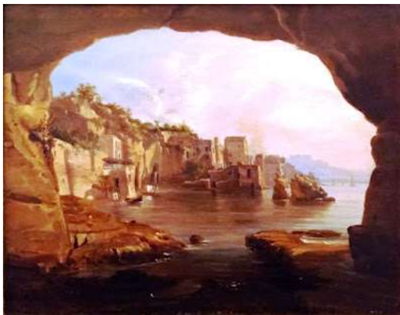
tav. 12 - Teodoro Duclère-La baia di San Pietro a Posillipo — pinacoteca della provincia di Napoli