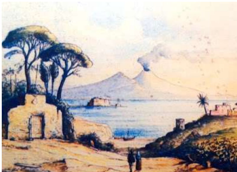
tav. 6 - Giuseppe Carelli - Scorcio di paesaggio – Napoli collezione della Ragione

Sempre di Consalvo proponiamo poi al lettore un Panorama di Napoli col Vesuvio (tav.7) di notevole qualità.