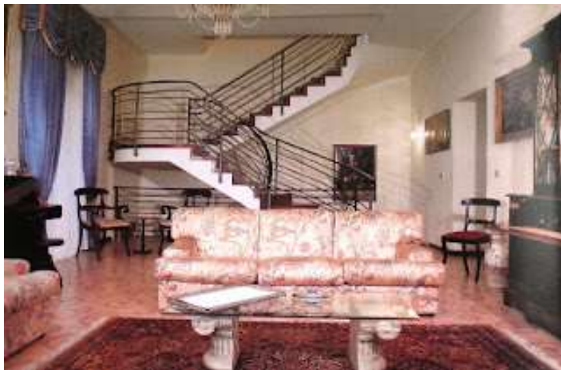
5 -Soggiorno al 1° piano

I lavori durarono otto mesi ed a dirigerli fu chiamato Avena, un celebre architetto, che, tra marmi pregiati, raffinate controsoffittature, prestigiosi parquet e sette bagni, da fare invidia a principi e reali, mi fece spendere una cifra doppia di quella dell'acquisto. Ma ne valse la pena a tal punto che la più accorsata rivista di arredamento d'Italia: Casa mia, volle dedicare la copertina e un servizio di dieci pagine (fig. da 1 a 9) alla mia modesta dimora. Dimenticavo l'indirizzo: dal 1980 ad oggi via Manzoni 261 B, dal primo giugno prossimo piazza Achille della Ragione.