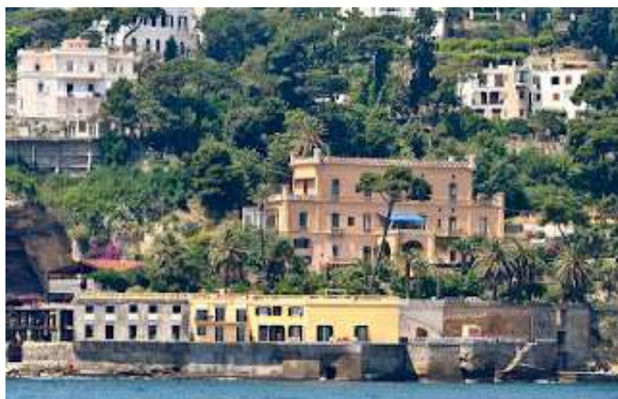
fig. 25 - Villa Gallotti

industriale dalla spettacolare balconata a picco sul mare del suo appartamento.