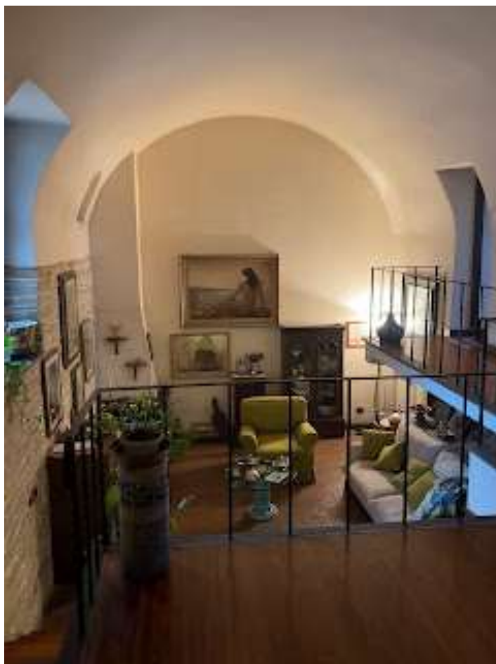
Fig.3 dislivello tra appartamenti

Vi è uno splendido giardino di oltre mille metri quadrati, dominato da piante di arance maltesi e da una fioritura ubiquitaria profumata, con alcune serre (fig.4) specializzate in rose, ciclamini e ortensie.