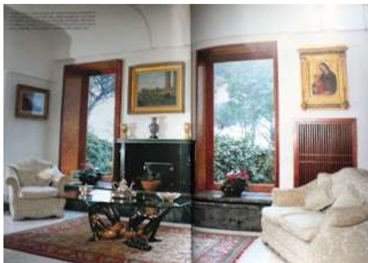
7 - Affacciata sul giardino