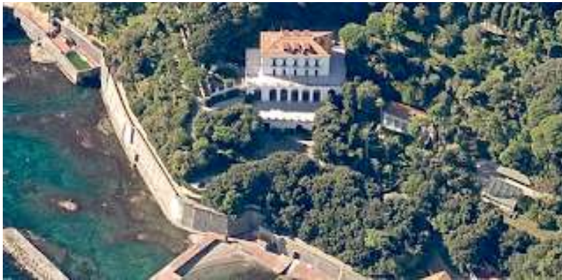
fig. 22 - Villa Rosebery dal cielo