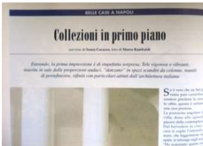
fig.1 - Articolo su Casa Mia gennaio 1997

Fino a 19 anni sono vissuto nella casa natale di via Salvator Rosa 29 int. 6 al secondo piano di un palazzo di 4 piani con 4 negozi di proprietà dei fratelli della Ragione. La casa era costituita da una grande camera da letto con soffitti affrescati, che affacciava sulla strada con un balcone e dove ho dormito a fianco dei miei genitori fino all'età di 14 anni, quando mi trasferii in una camera contigua dell'appartamento liberatosi dall'inquilino. Vi era poi uno studio che la sera si trasformava in camera da letto di mio fratello, una camera da pranzo con una grande balconata che affacciava inaspettatamente su un giardino, un tinello con annessa cucina con delle finestre che protrudevano su un cortile di bassi ed infine un antibagno e una toilette quanto mai modesta. Poscia per stare vicino alle