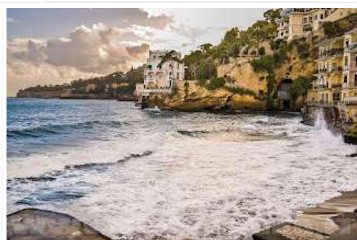
fig. 12 - Villa Martinelli

E pensare che li definivano «casini», quei superbi palazzi che degradano sul mare di Posillipo. Mica per offesa, casino stava