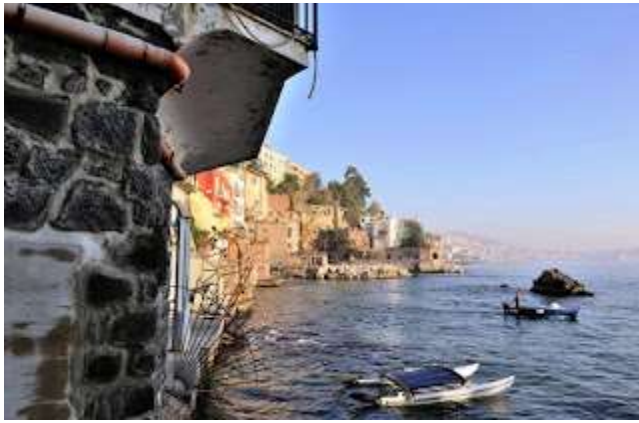
fig. 34 - San Pietro ai due frat