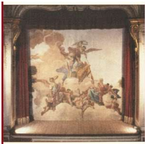
Il palcoscenico del teatrino in una foto del 1991

In passato il teatro ospitò importanti figure politiche come l'Imperatore Giuseppe II e re Luigi di Baviera che ne apprezzarono il gusto e il decoro. Tuttavia, la struttura in oggetto ha fatto i conti anche un periodo di decadenza, in cui varie opere d'arte furono messe a rischio; nella seconda guerra mondiale, infatti, un gruppo di alleati, che requisirono l'edificio, si curarono molto poco dell'antica struttura e misero a repentaglio alcuni suoi affreschi.