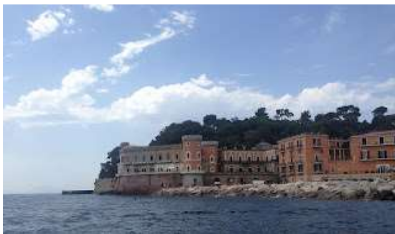
fig. 24 -Villa Volpicelli