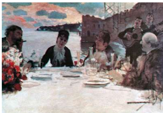
tav. 18 - Giuseppe De Nittis-Il pranzo a Posillipo - Milano, Galleria d'Arte Moderna