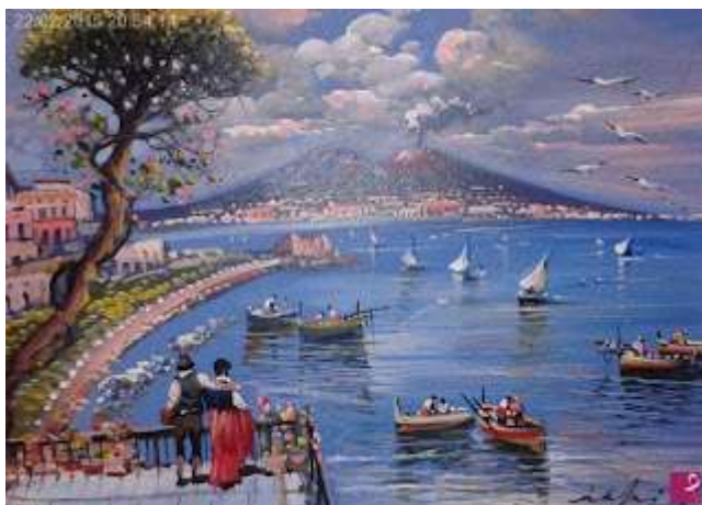
tav. 6 - Veduta-di Napoli con il pino