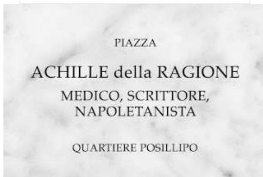
fig. 48 - Targa Achille