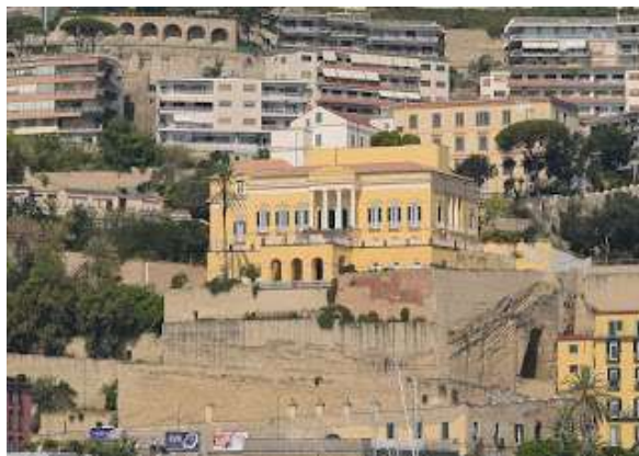
fig. 45 - Villa Doria d'Angri(vista dal mare)