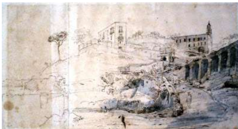
tav. 14 - Gaspar Van Wittel-Sant'Antonio a Posillipo - Napoli, museo di San Martino