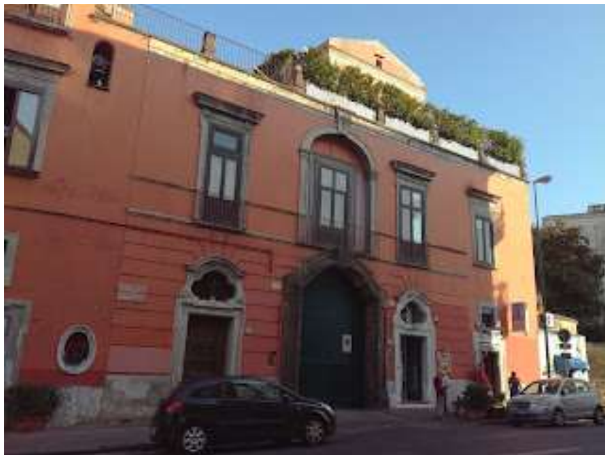
La facciata di Villa Patrizi

Villa Patrizi è una storica villa di Napoli, tra i quartieri di Posillipo e Vomero. Fu costruita nel XVIII secolo e rappresenta un pregevole esempio di architettura tardo-barocca. Gli ambienti, decorati ed eleganti, sono sovrastati da un terrazzo che si affaccia sul vasto giardino protendente verso il panorama del golfo. Tutti questi elementi donano, all'intera struttura, un aspetto affascinante e singolare; perciò dalle