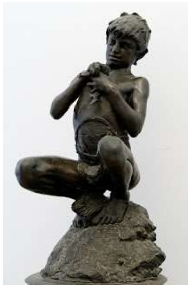
Fig. 35 - Il pescatore di Vincenzo Gemito