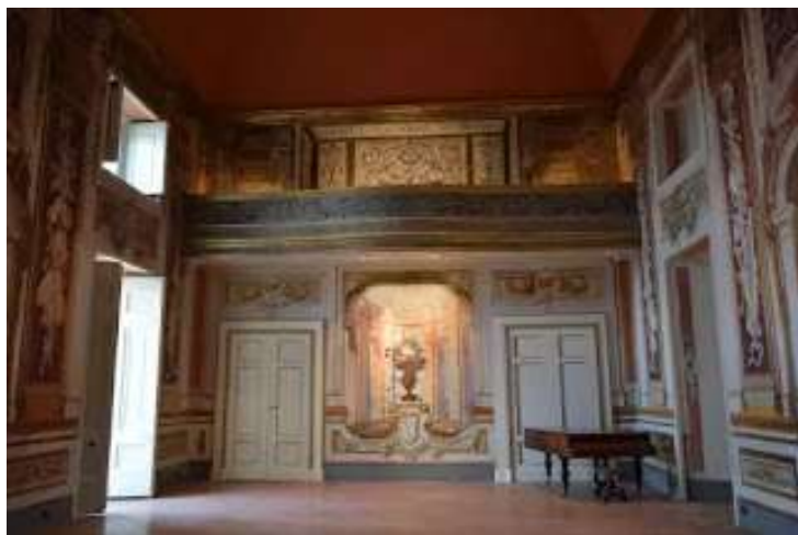
Sala decorata del teatro

Il teatro di villa Patrizi in tempi recenti ha ospitato importanti cantanti ed attori, per spettacoli ad uno o due personaggi: da Sergio Bruni a Leopoldo Mastelloni, da Peppe Barra a Rosalia Maggio a Ida Di Benedetto. Ma nel luglio del 1998 questo teatro è stato gravemente danneggiato da un incendio e da allora abbandonato sino al giugno del 2011, quando per evitare la rovina di questo luogo unico nel suo genere, nella sua bellezza e nella sua storia e dei suoi affreschi, si è proceduto al restauro della sala decorata, terminato nel dicembre 2014 sotto la sorveglianza della Soprintendenza. Villa Patrizi attualmente ospita: incontri, mostre e convegni, mantenendo viva la sua anima culturale. Un pezzo di storia napoletana che continua a ispirare e ad accogliere.