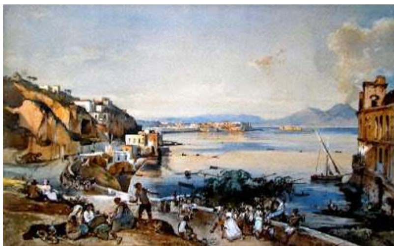
tav. 23 -Giacinto Gigante-Veduta di Napoli da Posillipo – Napoli, museo di Capodimont