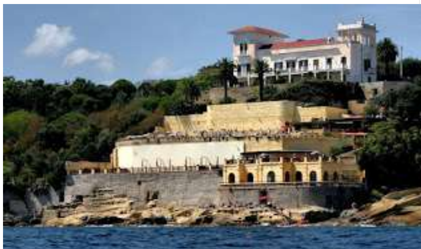
fig. 8 - Villa Fattorusso

ufficialmente, forse per gli altri, per me vivrà per sempre nel mio cuore, dove ha un posto di riguardo. Quasi ogni sera Arturo veniva trovarmi nel mio giaciglio a Rebibbia, a rendere lieti i miei sogni, a farmi compagnia, mitigando la mia tristezza. Discutevamo affacciati verso il mare nella sua splendida villa o passeggiavamo ad occhi chiusi per via Caracciolo e da napoletani veraci sapevamo distinguere chiaramente tra il fragore delle auto clacsonanti ed il frangersi delle onde sulla scogliera di Mergellina.