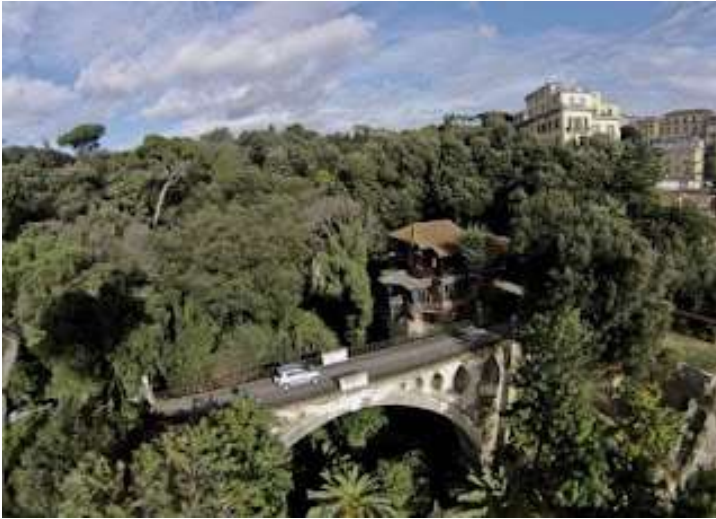
Fig. 19 – Villa Lucia

Passiamo ora ad una dimora da sogno dove abita l'ultima regina di Napoli, la mitica fondatrice di Napoli '99.