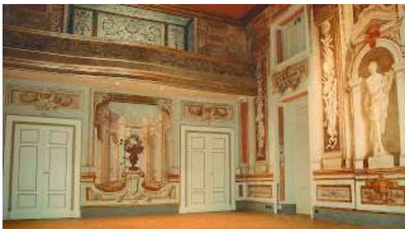
Il teatro di Villa Patrizi