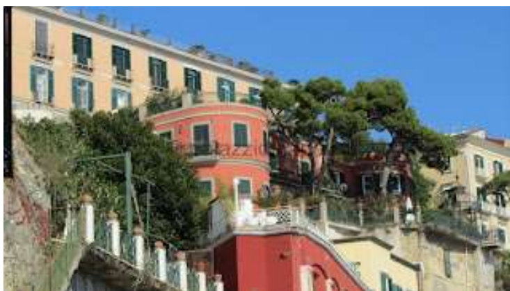
fig. 30 - Villa Cottrau