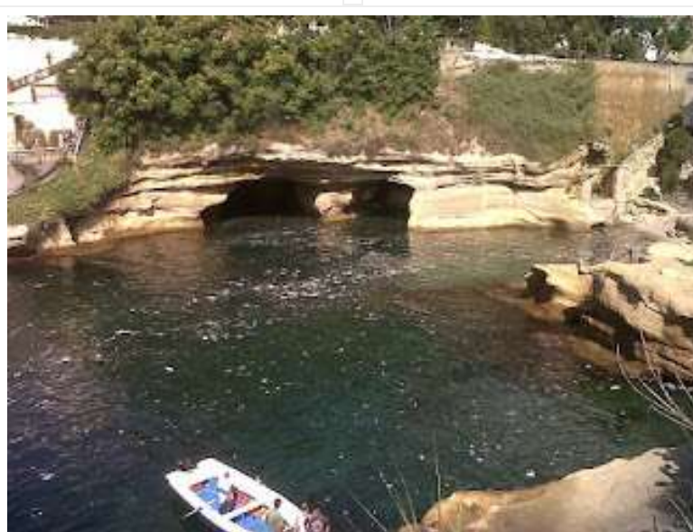
fig. 14 -Monnezza a mare

Nell' ex ospizio di Villa Marino, un tempo Bagno dei Preti, il principe di Piemonte Umberto si tuffava qui, tra Riva Fiorita (fig.13) e Villa Volpicelli, insieme ai “guaglioni”. E nelle 5 grotte aperte sul mare si costruivano apparecchi da bombardamenti di giorno e di sera, sopra la piattaforma, si