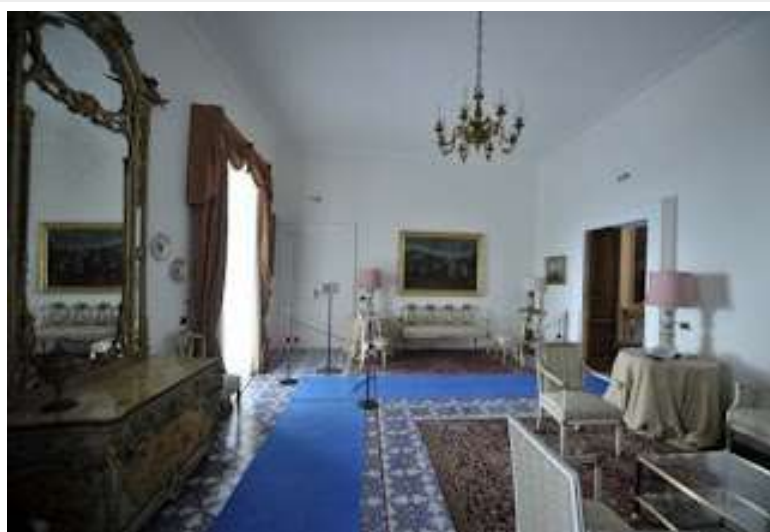
fig. 23 - Villa Rosebery (interno)