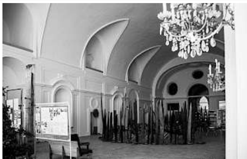
fig. 41 - Teatro di Palazzo Donn'Anna

L'edificio non è oggi visitabile e non costituisce alcun polo